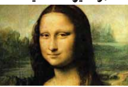
جنيف- قالت مؤسسة فنية في سويسرا إن اختبارات جديدة جريت على لوحة توصف بأنها النسخة الأصلية للموناليزا -. بريت صفى عرف الموادر و دافنشي في القرن الخامس عشر – قدمت دليلا جديدا على أنها من إبداع الفنان الإيطالي .

سياسية Political ♦ ثقافية cultural ♦شاملة comprehensive ♦ مستقلة